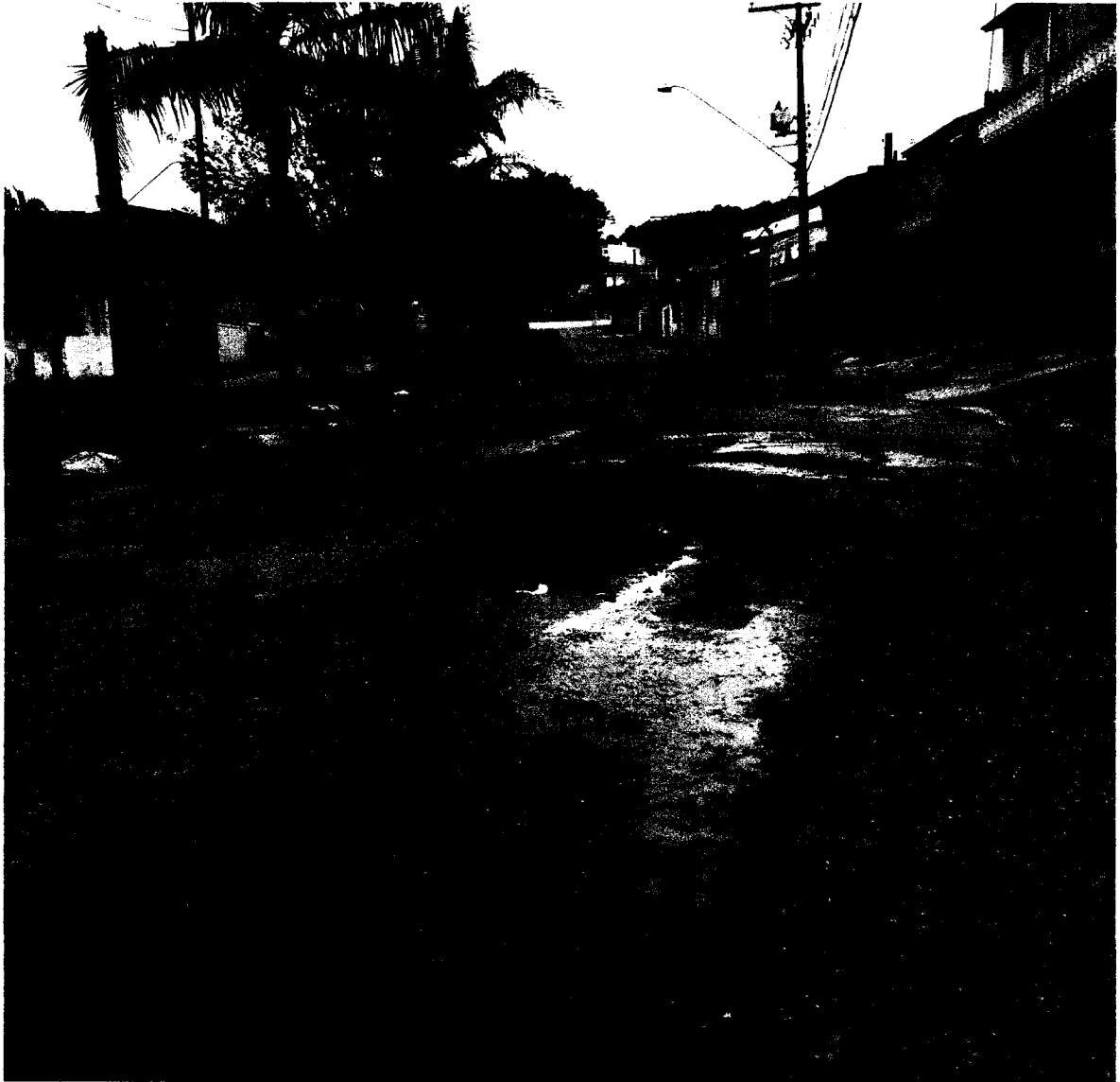
MANUTENÇÃO DO VAZAMENTO DE ESGOTO – Rua Benedito Pinhal - 190-Vila Cintra, Mogi das Cruzes